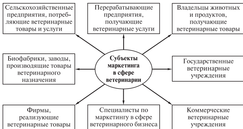
Рис. 1. Субъекты маркетинга в сфере ветеринарии

К сожалению, эффективность маркетинговой деятельности пока невысока. Задача заключается в том, чтобы постепенно создать перечисленные условия, подготавливать больше квалифицированных специалистов по маркетингу в области ветеринарии для каждого субъекта Российской Федерации, каждого крупного предприятия по производству и реализации товаров ветеринарного назначения. Принципы маркетинга должны знать и применять руководители ветеринарных служб районов, городов, субъектов РФ, а также ветеринарные врачи-предприниматели.